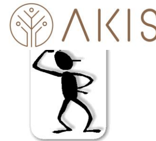
Tavola di concordanza