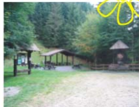
Area di sosta attrezzata di Castello Orsetto, punto di partenza e di arrivo del sentiero