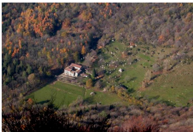
Terz'Alpe, vista aerea dell'agriturismo e del pascolo