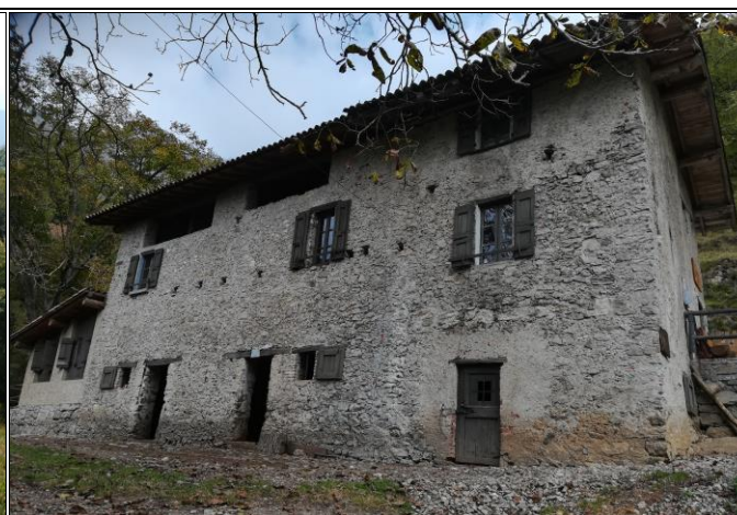
Carta di Prato della Noce di Vobarno