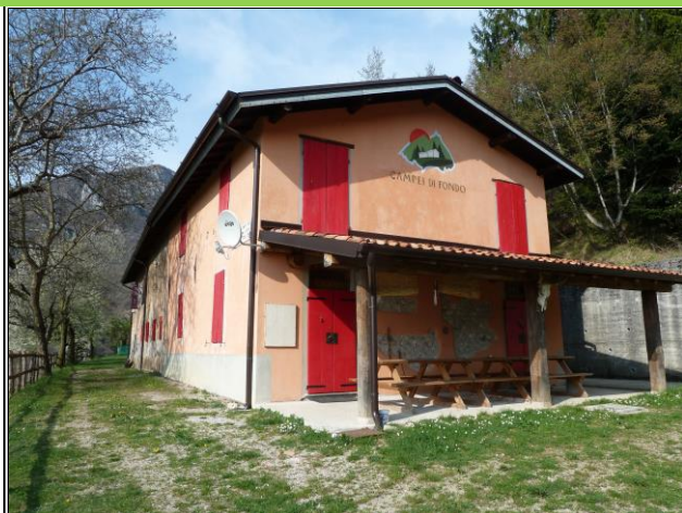
Malga Campiglio di Fondo e di Mezzo