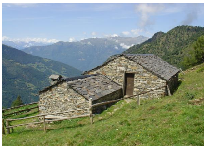
Baita Casera di Dosso Cavallo