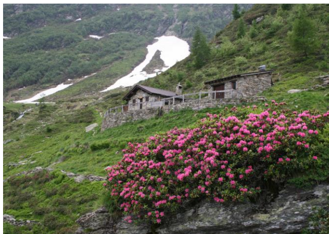
Baita di Castello