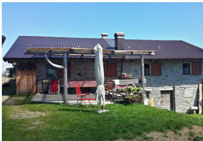
Capanna sociale Alpe Legnone