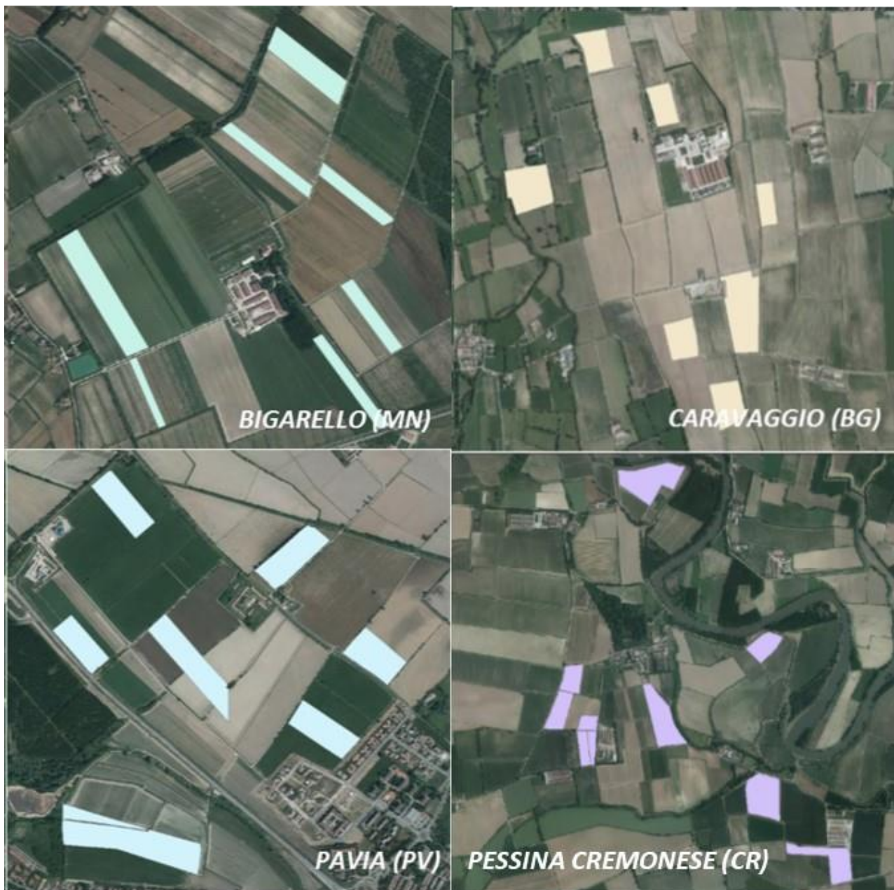
FIGURA 2 CAMPI MONITORATI NELLA CAMPAGNA 2018

In ogni area di campionamento si è proceduto con la raccolta di “campioni composti”, formati dall’unione e miscelazione di sub-campioni prelevati in numero variabile da 2 a 9 a seconda della dimensione dell’area stessa.