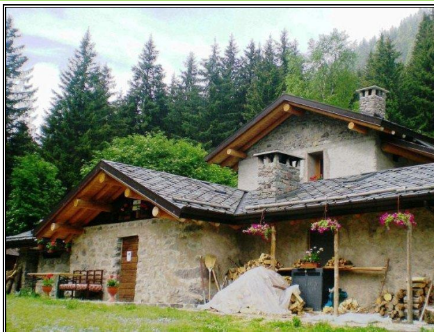
Malga Campolungo Inferiore