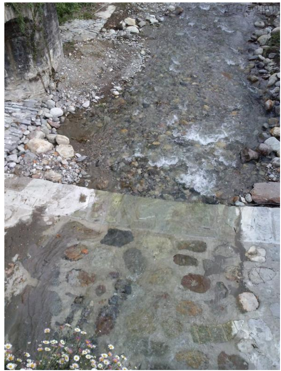
Realizzazione di selciato a valle del ponte romano: ante (sinistra) e post operam (destra) (vista dal ponte).